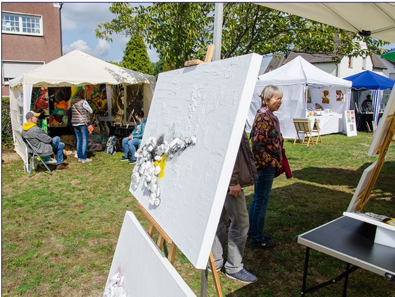
Wiese und Pavillons: Der 2. Kunstmarkt in Rünthe lockte unter den freien Himmen.

8. September 2019 Katja Burgemeister Dies & Das , Kultur , Lokalnachrichten Bergkamen 0