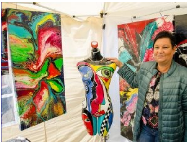
Kunst mit Lack.